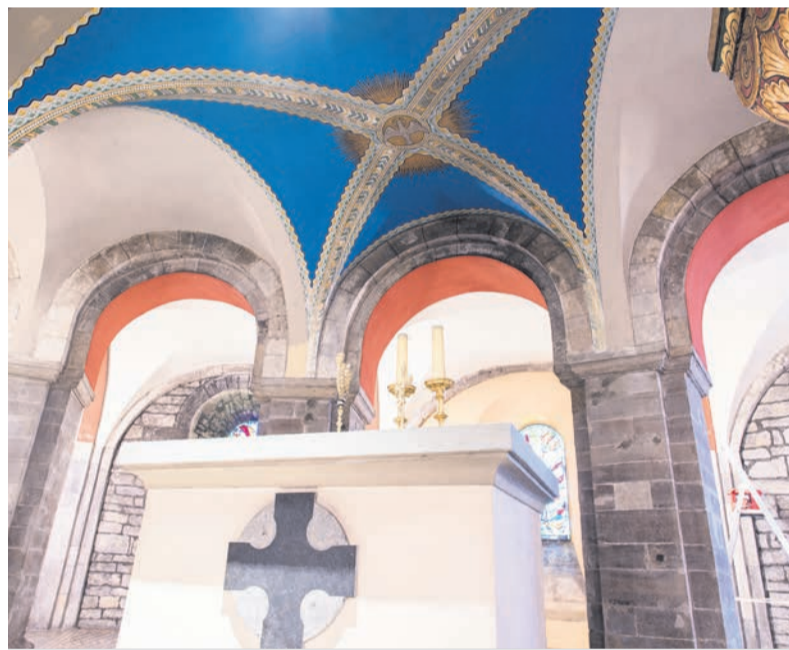
Het gedeelte boven en achter het altaar is altijd zo gehouden zoals architect Cuypers het bedoeld heeft