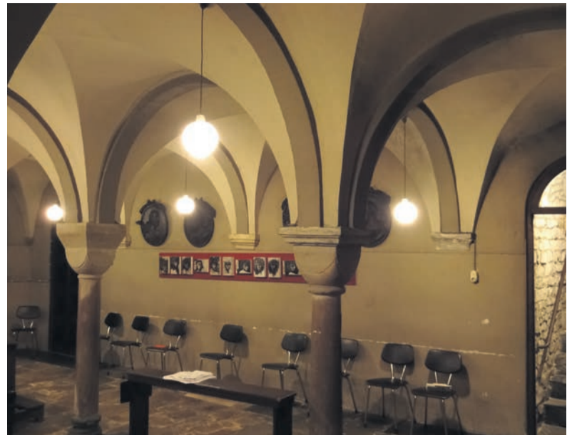
In de tachtiger jaren werd voor een mystiek-grijze kleur gekozen op de ribben

'In de crypte was de toestand van de schilderijen van Cuypers ronduit slecht', vertelt André Houben. In overleg met de toenmalige pastoor werd besloten om ze weg te schilderen, behalve rond het altaar. Gekozen werd voor een grijze steenkleur, die het geheel een wat duistere, mystieke sfeer gaf. De crypteruimte werd toch weinig gebruikt. 'We pasten destijds een verkiezelende muurverf toe', vertelt Houben. 'De wanden en plafonds zijn zeer vetig en beroet door de neerslag van