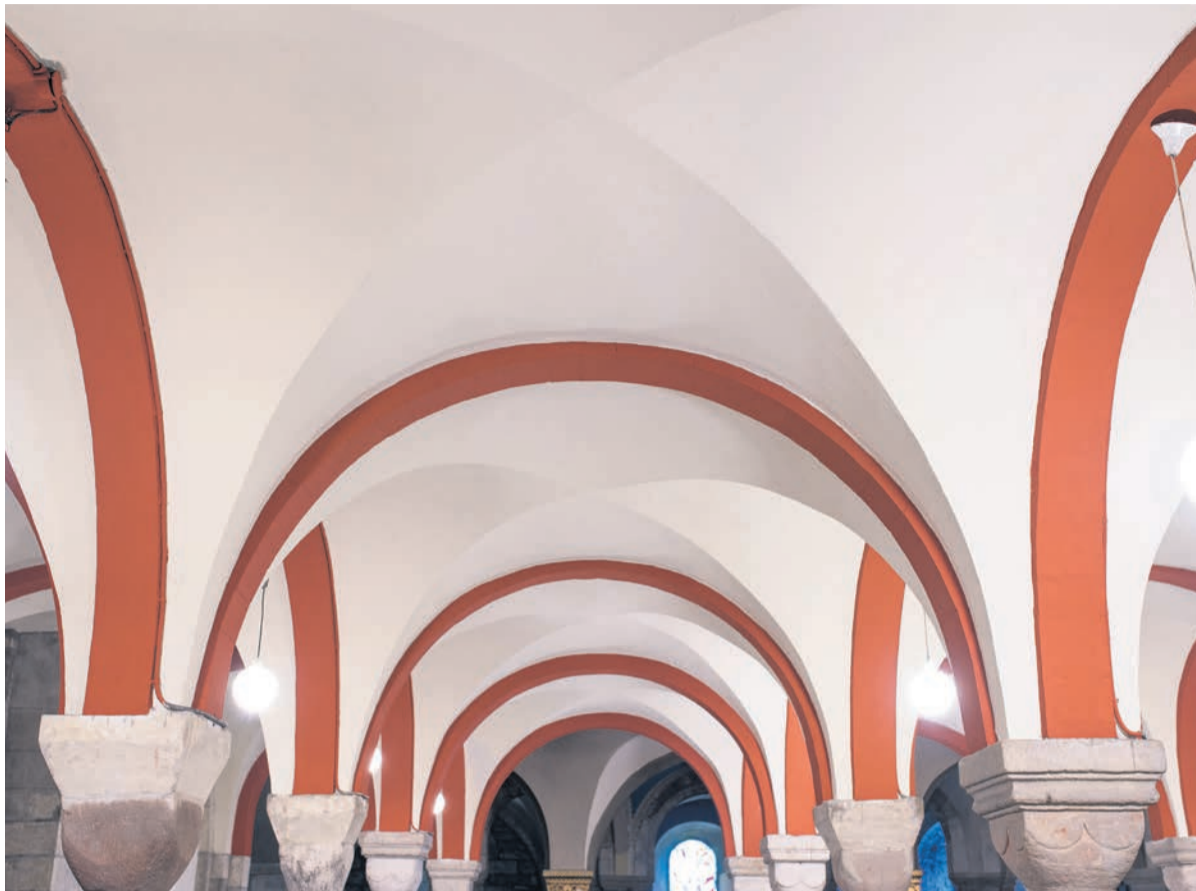
Het kruisgewelf in opgeleverde staat: het plafond is lichtgeel, al ziet het er op de foto wit uit

MAASTRICHT – De Onze Lieve Vrouwe Basiliek in Maastricht, een van de honderd belangrijkste monumenten van ons land, wordt al zo'n 43 jaar door Masco Schilders onderhouden. Onder de nieuwe pastoor werd de crypte geschilderd in een nieuw kleurplan. Werd die in de tachtiger 'mystiek grijs', nu keert kleur en licht terug.